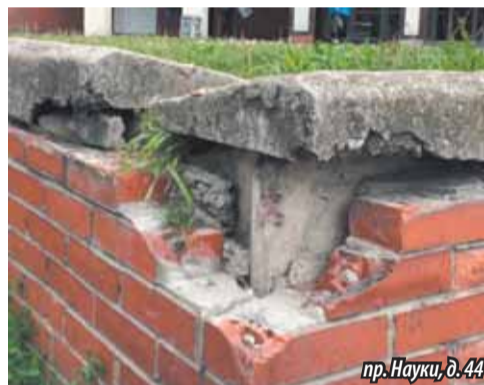
пр. Науки, д. 44

Ждем от администрации Калининского района конструктивных позитивных решений по данному вопросу.