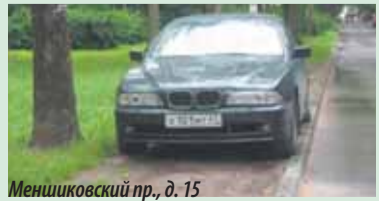
Меншиковский пр., д. 15