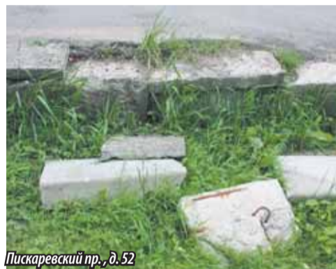
Пискаревский пр., д. 52