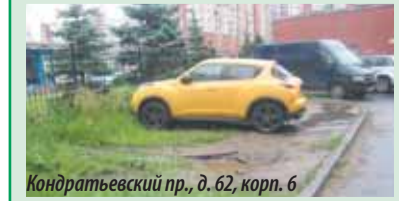
Кондратьевский пр., д. 62, корп. 6

портных средств на территориях зеленых насаждений. В МО Пискаревка и в летний период многие автовладельцы без зазрения совести паркуют свои машины на газоне. На момент сдачи этого номера газеты в печать сотрудниками муниципального образования было выявлено девять злостных нарушителей, установлены владельцы трёх автомобилей – к ним приняты меры административного воздействия.