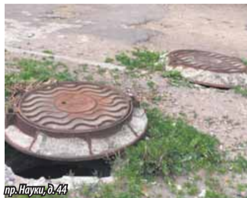
пр. Науки, д. 44