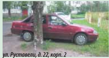
ул. Руставели, д. 22, корп. 2