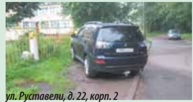
ул. Руставели, д. 22, корп. 2