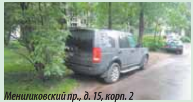
Меншиковский пр., д. 15, корп. 2